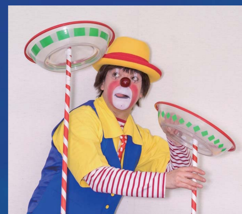
ペッピーザクラウン